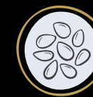
Semi di sesamo