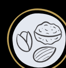
Frutta a guscio