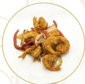
194. GAMBERI* SALE E PEPE con cipolla e peperone €7