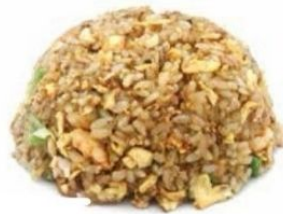
156. RISO SPECIALE salsa di soia, uovo verdure* €5,5 🌿