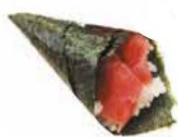
71. TONNO tonno*, avocado, sesamo € 4