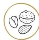
Frutta a guscio