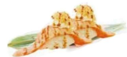
65. SAKE PHI salmone* scottato, philadelphia, patate, teriyaki €4