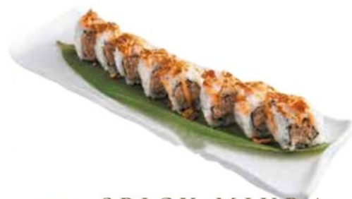
25. SPICY MIURA salmone* cotto, spicy mayo, cipolle fritte € 9