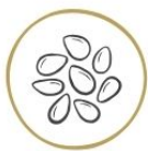
Semi di sesamo