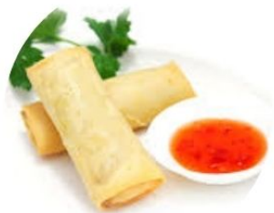
101. INVOLTINI PRIMAVERA di verdure 2 pz 🌿