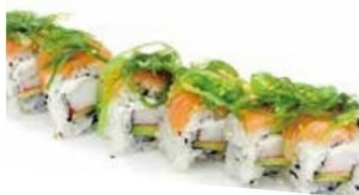
15. WAKAME ROLL

surimi , avocado , philadelphia , salmone , wakame esterno*