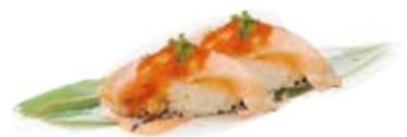
63. SAKE FLAMBÉ salmone* scottato, teriyaki, cipolline €4