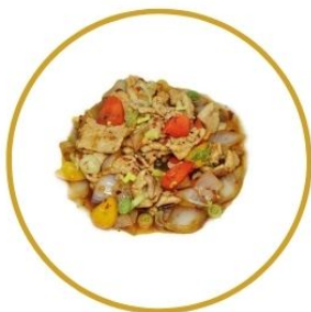
204. MAIALE* PICCANTE con peperone e verdure