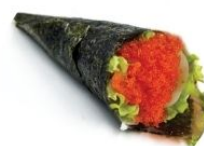
75. TOBBIKO uova di pesce*, avocado, sesamo € 4