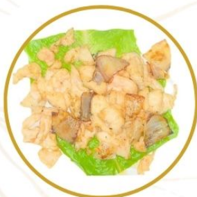
187. POLLO* ALLA PIASTRA con cipolle €6