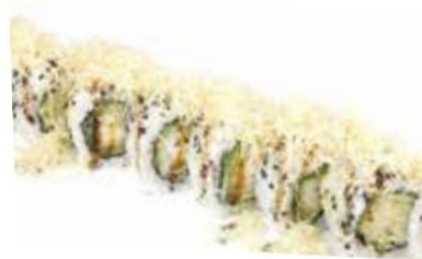
10. EBI ROLL gambero* fritto, teriyaki, mayo, cipolle fritte € 12