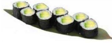
34. HOSO AVO con avocado 🥑 € 4