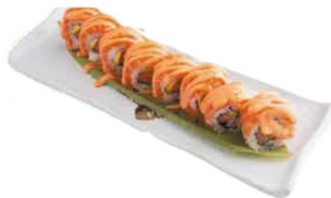
27. SAKE SPICY avocado, salmone*, salmone esterno, spicy mayo 🌶️ € 11