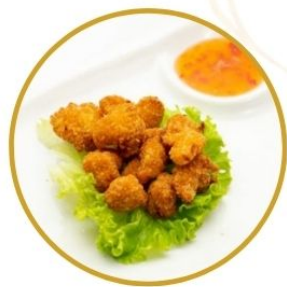
180. POLLO* FRITTO tochetti di pollo €5,5