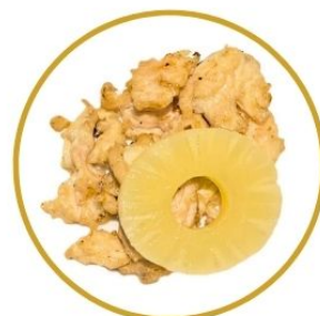
188. POLLO* ANANAS con ananas €6