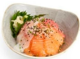
95. CIRASHI MIX riso, pesce misto*, sesamo € 8