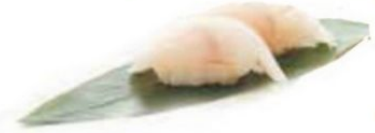
57. PESCE BIANCO spigola* €3