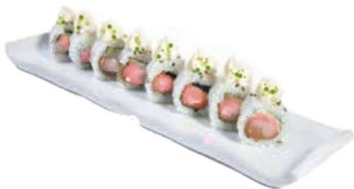
20. MIURAPI salmone* cotto, philadelphia, pistacchio, teriyaki € 11