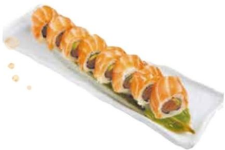
26. SAKESALMON avocado, salmone*, salmone esterno € 11