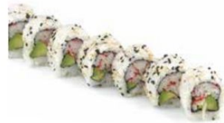
4. CALIFORNIA surimi*, avocado, maionese € 9