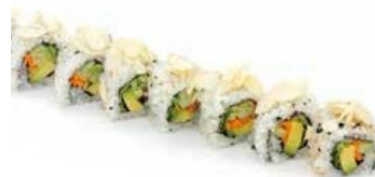
16. CHICKEN ROLL

pollo fritto , mayonnase , insalata , teriyaki