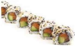
1. OCEAN salmone*, avocado € 9

ROLLS CON PESCE E RISO SERVITI PER PORZIONE DA 8 PEZZI