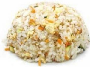
159. RISO ALLE VERDURE uovo, verdure €5 🌿