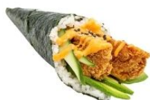
74. CHICKEN pollo panato, insalata, maionese € 3,50