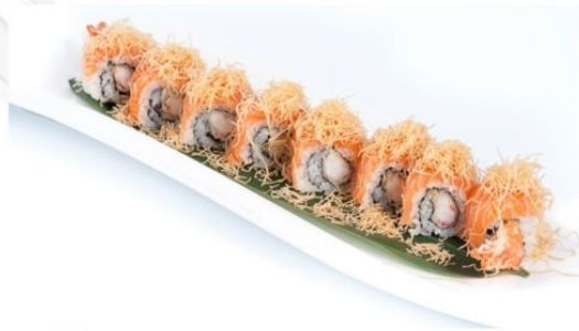
7. TIGER ROLL gambero* fritto, patate salmone esterno, teriyaki € 12

ROLLS CON PESCE E RISO SERVITI PER PORZIONE DA 8 PEZZI