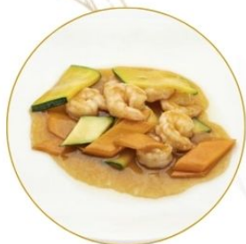
195. GAMBERI* CON VERDURE in salsa di soia €7