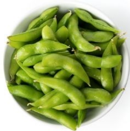
102. EDAMAME* fagiolini di soia 🌿