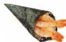
72. GAMBERO gambero*, avocado e sesamo € 4