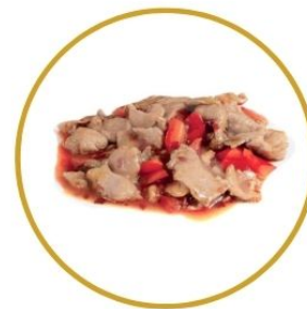
206. MAIALE* CON PEPERONE saltato