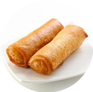
105. INVOLTINI DI GAMBERI* di verdure 2 pz €3,50