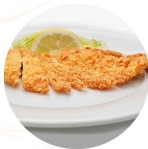
117. COTOLETTA DI MAIALE panata €7