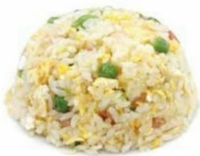
158. RISO CANTONESE prosciutto, verdure*, uovo €5,50