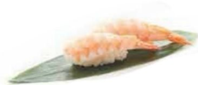
58. EBI gambero cotto* €3