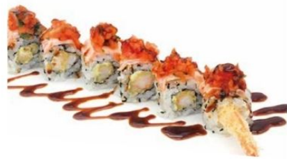
8. TIGER SPECIAL gambero fritto*, spicy mayo, salmone esterno, tartare di pomodorini, teriyaki 🌶️ € 12