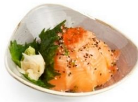
96. CIRASHI SALMONE riso, salmone*, sesamo € 8