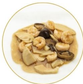
191. GAMBERI* FUNGHI E BAMBÙ in salsa di soia €7