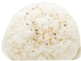
155. RISO BIANCO al vapore €3 🌿