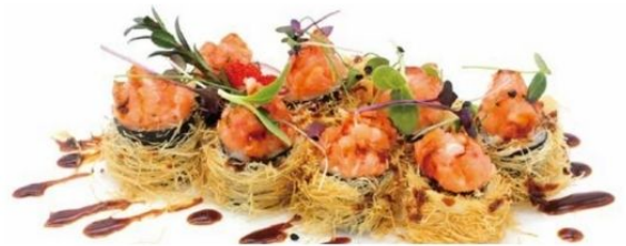
35. HOSO NIDO salmone*, tartare di salmone piccante, teriyaki €7 🌶️