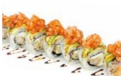
11. DRAGON ROLL gambero fritto*, philadelphia, avocado, tartare di salmone* e teriyaki € 13