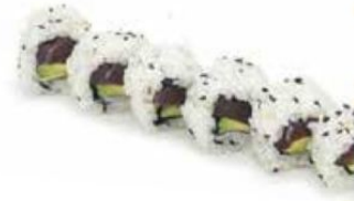
2. TUNA tonno*, avocado € 9,50