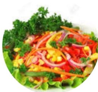
107. INSALATA VERDE vegetariana €5 🌿