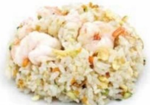
157. RISO GAMBERI gamberi*, uovo, mais €6,5