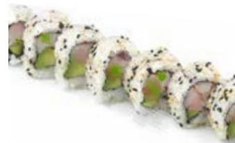
6. YASAI cetriolo, avocado 🥒 € 8