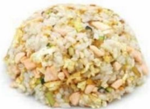
161. RISO AL SALMONE uovo, salmone* €6