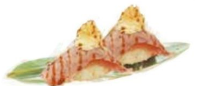
66. TUNA PHI tonno* scottato, philadelphia, patate, teriyaki €4