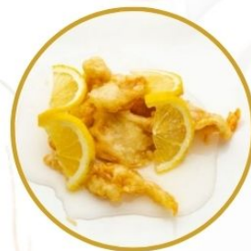
182. POLLO* AL LIMONE fritto con limone €6