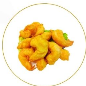
196. GAMBERETTI* FRITTI in pastella €7