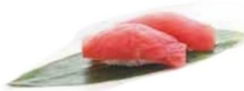
56. TONNO tonno* €3