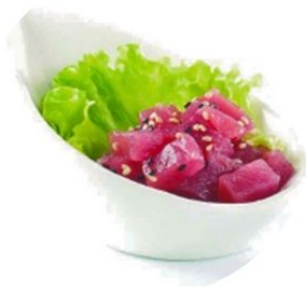
92. SAKE TARTARE tartare di salmone* , salsa ponzu , sesamo €8