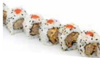
14. ANGUS ROLL