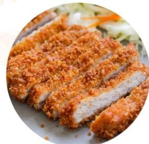
116. COTOLETTA DI MANZO panata €7