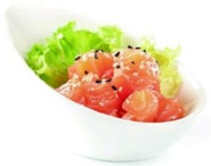
90. SAKE TARTARE tartare di salmone* piccante e sesamo 🌶️ €8