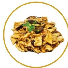
203. MAIALE* FUNGHI E BAMBÙ in salsa di soia €6