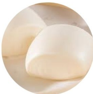
112. PANE CINESE* al vapore 2 pz €4 🌿