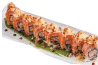
13. SAKE ONION

ROLLS CON PESCE E RISO SERVITI PER PORZIONE DA 8 PEZZI