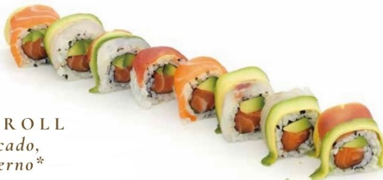
17. RAINBOW ROLL

salmone* , avocado , pesce misto esterno*