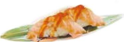
62. SPICY SAKE 🌶️ salmone*, spicy mayo, teriyaki, tobiko € 3,50