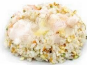
162. RISO AL POLLO uovo, pollo, verdure* €5,5