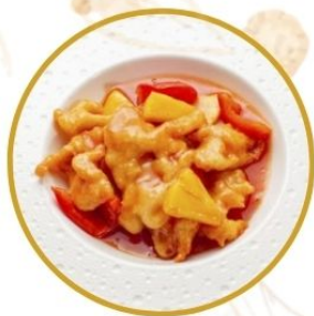
181. POLLO* IN AGRODOLCE fritto con verdure €6