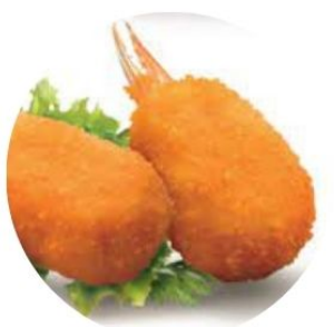
114. CHELE DI GRANCHIO* 2 pezzi €4