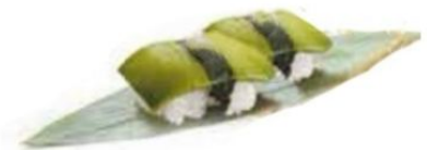
60. AVOCADO avocado €3 🥑