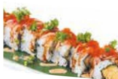
12. EBI FLAMBÉ gambero fritto*, salmone esterno scottato, teriyaki e cipolline € 12