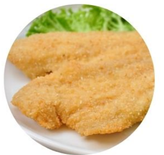
118. FILETTO* DI PESCE panata €7