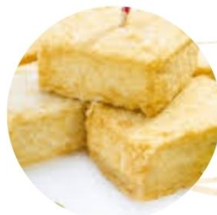
106. TOFU FRITTO soia e sesamo €5 🌿