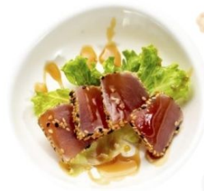
122. TUNA TATAKI tonno* scottato con sesamo €8