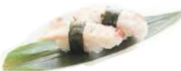
59. POLPO polpo* €3