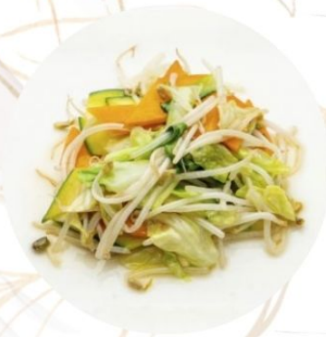
230. VERDURE MISTE mix di verdure €6 🌿