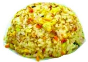
160. RISO AL CURRY uovo, verdure*, pollo, curry €5,5