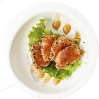
123. SAKE TATAKI salmone* scottato con sesamo €8