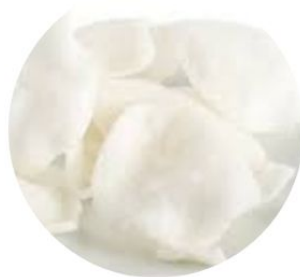
109. CHIPS DI GAMBERI €2,50