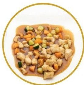
183. POLLO* ALLE MANDORLE con verdure €6