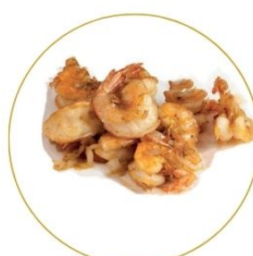
197. GAMBERI* ALLA PIASTRA con cipolle €7