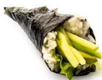
77. YASAI cetriolo, avocado, sesamo € 3,50 🌱