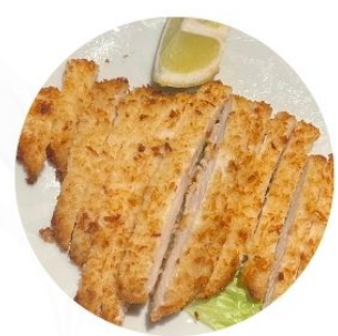
119. COTOLETTA DI POLLO panata €7