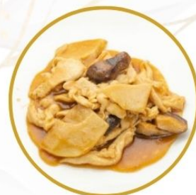
185. POLLO* FUNGHI E BAMBÙ in salsa di soia €6