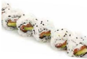
3. PHILADELPHIA salmone*, avocado, philadelphia € 10