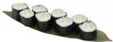
33. HOSO KAPPA con cetriolo 🥒 € 4