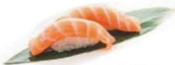
55. SALMONE salmone* €3