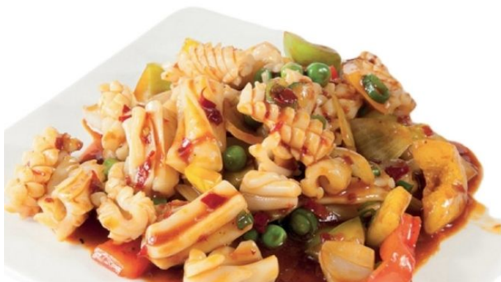
212. CALAMARI* CON VERDURE con salsa di soia e verdure €7