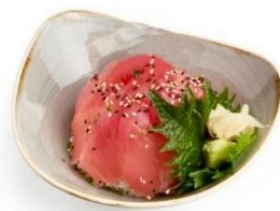
97. CIRASHI TONNO riso, tonno*, sesamo € 8