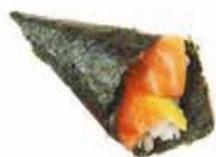
70. SALMONE salmone*, avocado, sesamo € 4