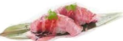
64. TUNA FLAMBÉ tonno* scottato, teriyaki, cipolline €4