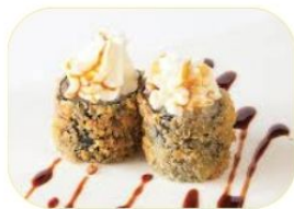
36. HOSO FRITTO EBI gambero*, philadelphia, mandorle, teriyaki €7