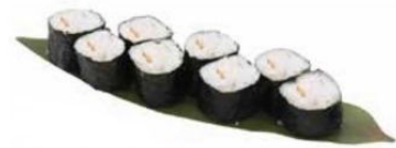
32. HOSO EBI con gambero* cotto € 5