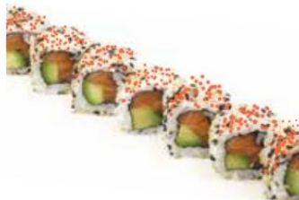
5. TOBBIKO salmone*, avocado, uova di pesce* € 10