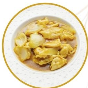
186. POLLO* AL CURRY con cipolle €6