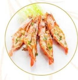
192. GAMBERONI* GRIGLIATI 2 pezzi €6