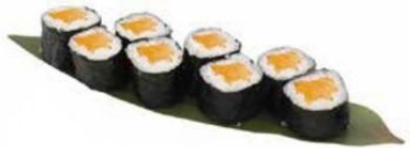
30. HOSO SAKE con salmone* € 5