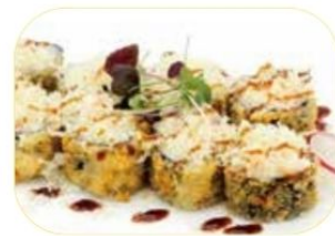
37. HOSO FRITTO SAKE salmone*, philadelphia, patate, teriyaki €7