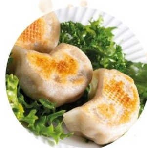
110. RAVIOLI* BRASATI di carne 3 pz €4