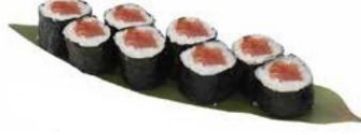
31. HOSO TUNA con tonno* € 5