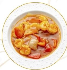
190. GAMBERI* IN AGRODOLCE fritti con verdure €7