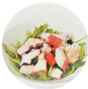
108. INSALATA DI MARE* con aceto €6