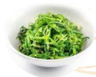
103. GOMAWAKAME insalata di alghe* 🌿