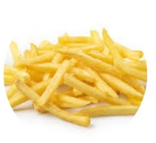
115. PATATINE* FRITTE 🌿 € 2,5