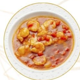
193. GAMBERI* PICCANTI in salsa chilly 🌶️ €7