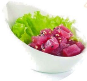
91. TUNA TARTARE tartare di tonno* piccante e sesamo 🌶️ €8