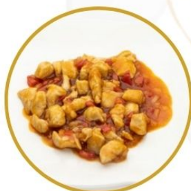
184. POLLO PICCANTE in salsa chilly 🌶️ €6