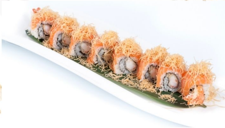
7. TIGER ROLL gambero* fritto, patate salmone* esterno, teriyaki € 12

ROLLS CON PESCE E RISO SERVITI PER PORZIONE DA 8 PEZZI