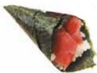
71. TONNO* tonno, avocado, sesamo € 4