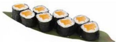
30. HOSO SAKE con salmone* € 5