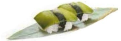
60. AVOCADO avocado* €3 🌿