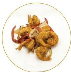
194. GAMBERI* SALE E PEPE con cipolla e peperone €7