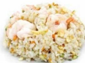
157. RISO GAMBERI gamberi*, uovo, mais €6,5