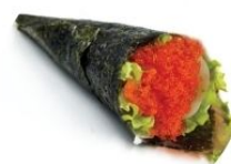
75. TOBBIKO uova di pesce*, avocado, sesamo € 4