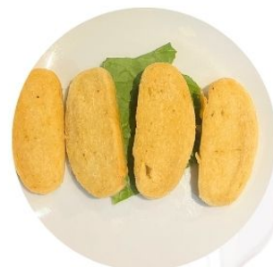
113. PANE FRITTO* 4 pezzi €4 🌱