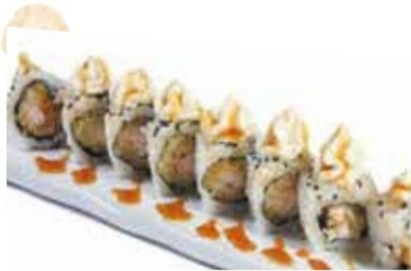
9. EBI PHILA gambero* fritto, teriyaki, philadelphia