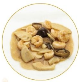
191. GAMBERI* FUNGHI E BAMBÙ in salsa di soia €7