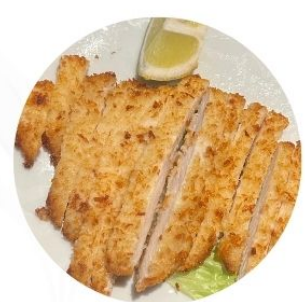
119. COTOLETTA DI POLLO panata €7