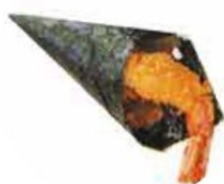
73. TEMPURA gambero fritto*, teriyaki e sesamo € 4