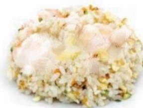
162. RISO AL POLLO uovo, pollo, verdure* €5,5