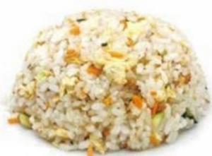
159. RISO ALLE VERDURE uovo, verdure 🌿 €5