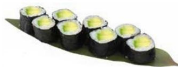
34. HOSO AVO con avocado 🥑 € 4