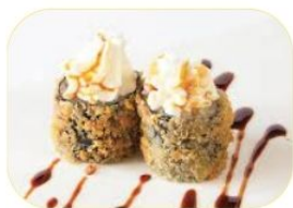
36. HOSO FRITTO EBI gambero*, philadelphia, mandorle, teriyaki €7