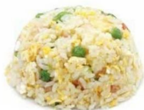
158. RISO CANTONESE prosciutto, verdure*, uovo €5,50