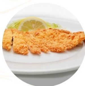
117. COTOLETTA DI MAIALE panata €7