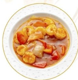
190. GAMBERI* IN AGRODOLCE fritti con verdure €7