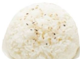
155. RISO BIANCO al vapore €3 🌿