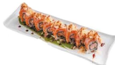
13. SAKE ONION salmone*, avocado, mayo, salmone esterno, cipolle fritte, teriyaki € 11