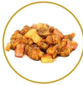
202. MAIALE* IN AGRODOLCE fritto con verdure €6