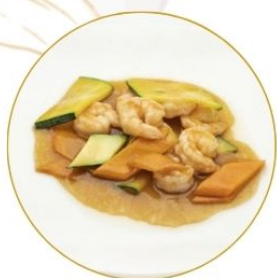
195. GAMBERI* CON VERDURE in salsa di soia €7