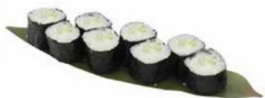
33. HOSO KAPPA con cetriolo 🥒 € 4