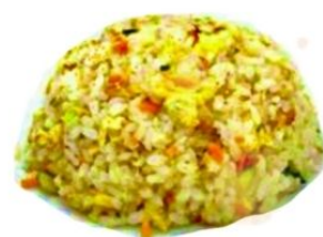
160. RISO AL CURRY uovo, verdure*, pollo, curry €5,5