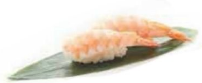
58. EBI gambero cotto* €3