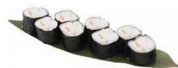
32. HOSO EBI con gambero* cotto € 5