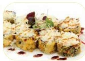
37. HOSO FRITTO SAKE salmone*, philadelphia, patate, teriyaki €7