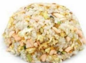
161. RISO AL SALMONE uovo, salmone* €6