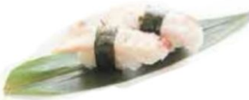
59. POLPO polpo* €3