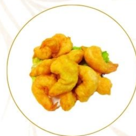
196. GAMBERETTI* FRITTI in pastella €7