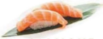
55. SALMONE salmone* €3