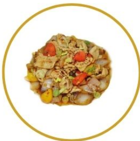
204. MAIALE* PICCANTE con peperone e verdure 🌶️ €6,5