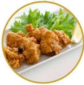
201. MAIALE* FRITTO tocchetti di maiale €6