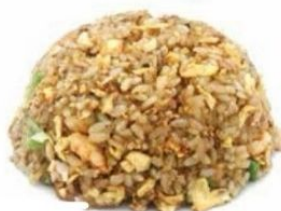
156. RISO SPECIALE salsa di soia, uovo verdure €5,5 🌿