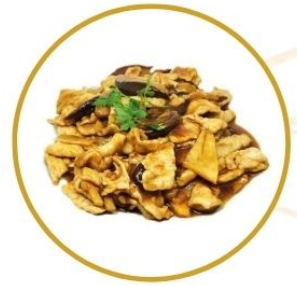
203. MAIALE* FUNGHI E BAMBÙ in salsa di soia €6