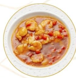
193. GAMBERI* PICCANTI in salsa chilly 🌶️ €7