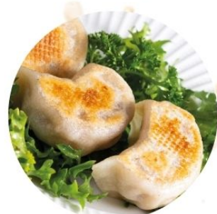
110. RAVIOLI BRASATI* di carne 3 pz €4