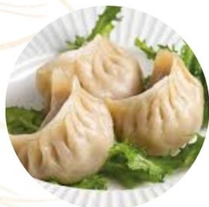
111. RAVIOLI AL VAPORE* di carne 3 pz €4