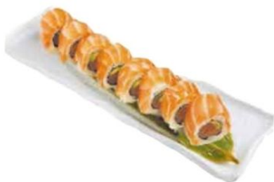
26. SAKE SALMON avocado, salmone*, salmone esterno € 10