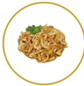
205. MAIALE* PIASTRA con cipolle €6,5