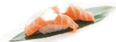
61. SALMONE PHILADELPHIA salmone*, philadelphia €3,5