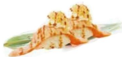
65. SAKE PHI salmone* scottato, philadelphia, patate, teriyaki €4