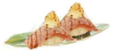
66. TUNA PHI tonno* scottato, philadelphia, patate, teriyaki €4