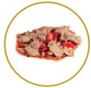
206, MAIALE* CON PEPERONE saltatato €6