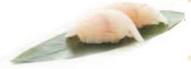
57. PESCE BIANCO spigola* €3