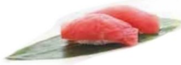
56. TONNO tonno* €3