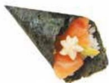
76. MIURA* salmone cotto, sesamo, philadelphia € 3,50