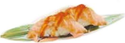
62. SPICY SAKE 🌶️ salmone*, spicy mayo, teriyaki, tobiko € 3,5