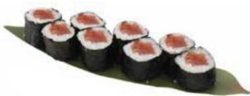
31. HOSO TUNA con tonno* € 5