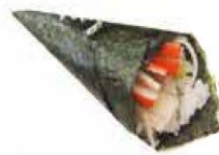
78. SURIMI* surimi, avocado, spicy mayo, teriyaki 🌶️ € 4